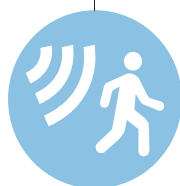
Système d'Alarme Tiers