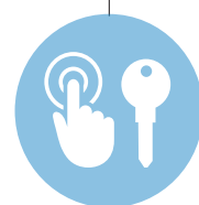
Produits tiers Gestion des clés et des biens