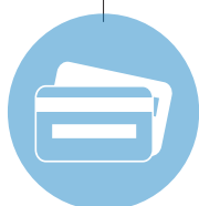
Système d'Accès Tiers