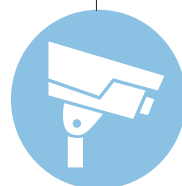
Système Vidéo Tiers