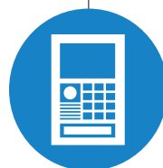
Système Intercom Tiers